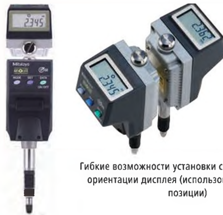
Гибкие возможности установки с переключением ориентации дисплея (использование верхней позиции)